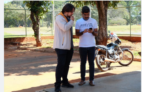
Coordination and logistics